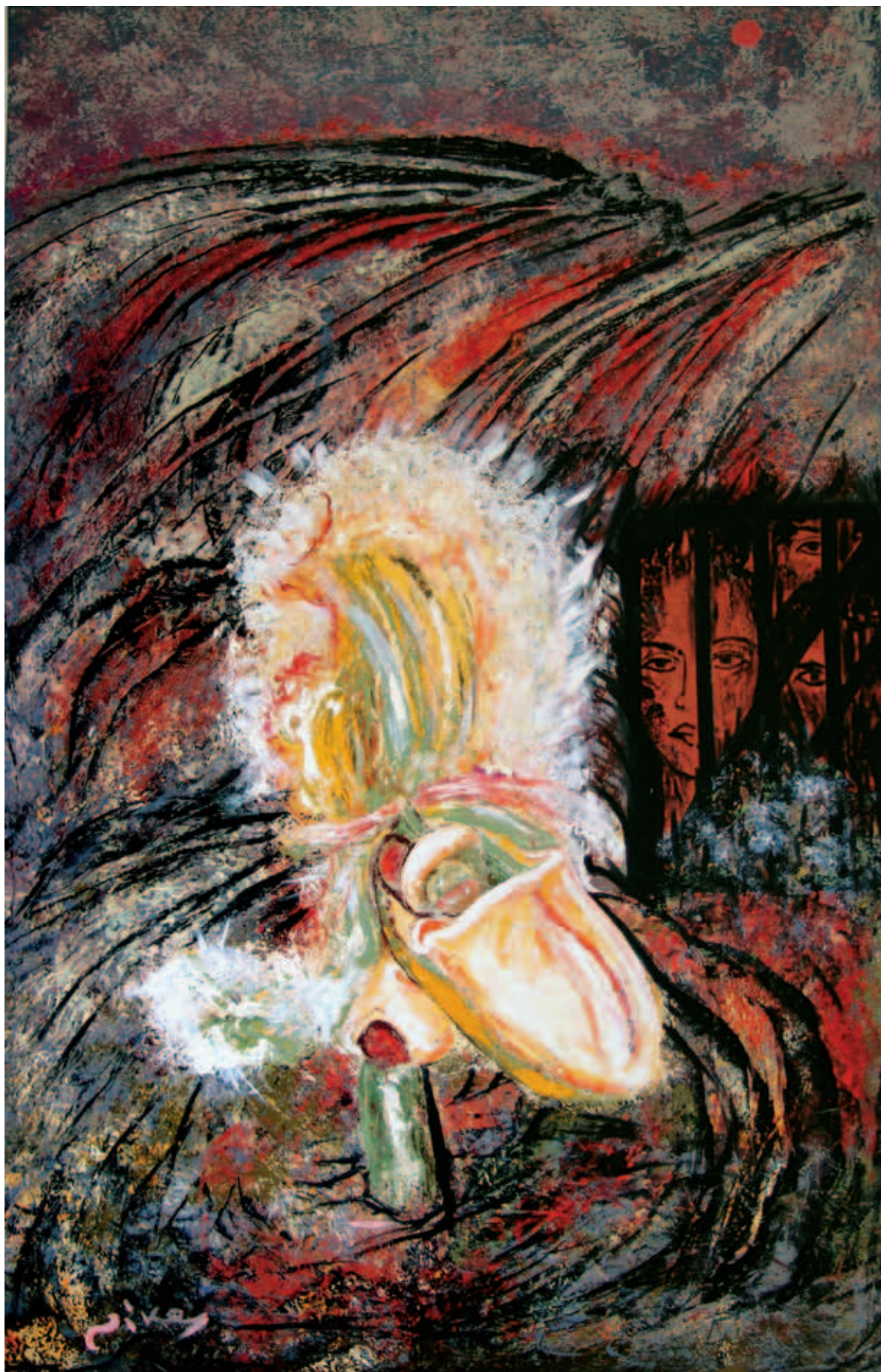
Όνειρα φυλακισμένα 100 X 160 Λάδι σε Μ.Τ.Ε. 2007