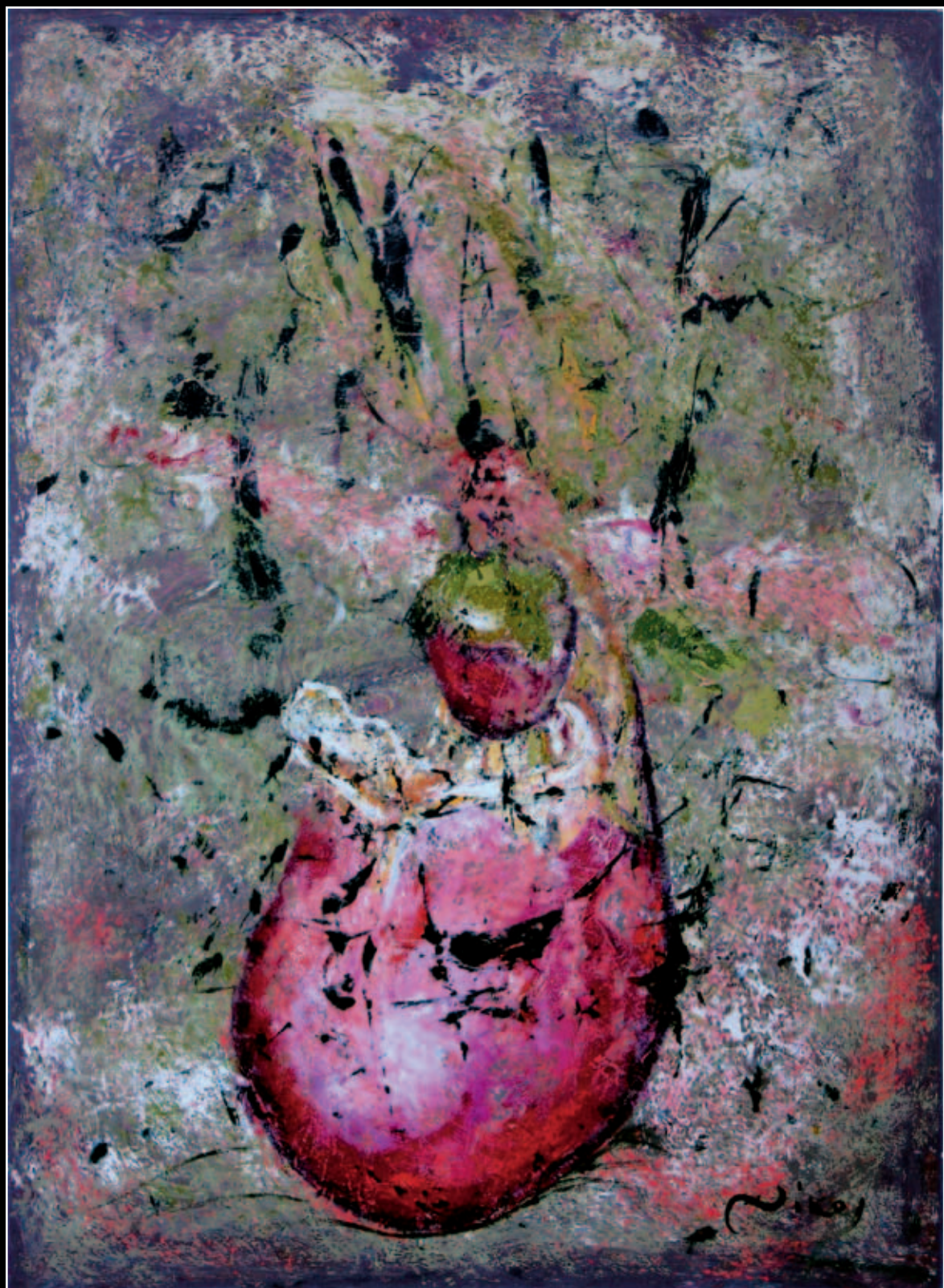
Ακάθιστος καημός 70 X 100 Λάδι σε Μ.Τ.Φ. 2007