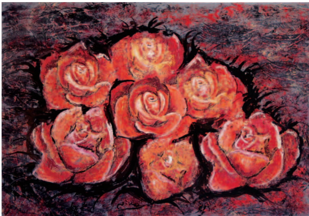
Κρυσταλλώθηκε η σιωπή 70 X 100 Λάδι σε Μ.Τ.Φ. 2006