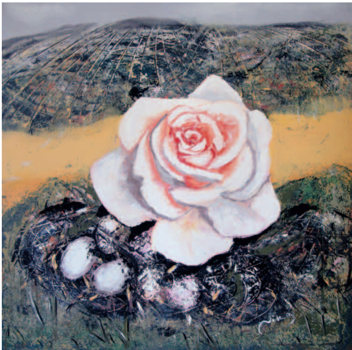
Σφαιρικά τρίγωνα 100 X 100 Λάδι σε Μ.Τ.Φ. 2007

με την ευρεία έννοια και έκφρασή του θα μπορέσει να δώσει την προοπτική ανασυγκρότησης του κατεστραμμένου κόσμου. Ο έρωτας είναι το μέλλον. Η ζωγραφική του Νίκου και η εν γένει στάση του δεν αποπνέει απαισιοδοξία. Καταγγέλλει, αλλά δεν υποτάσσεται, δεν απελπίζεται, δεν οδηγείται σε αδιέξοδα. Η υπαρξιακή αγωνία του είναι εμφανής, αλλά και διάσπαρτα τα μηνύματα αισιοδοξίας και ελπίδας στους πίνακές του. Ελπίζει πως ο κόσμος, αν και είναι κατεστραμμένος και ζοφερός, δεν είναι όμως χαμένος για πάντα. Μέσα από τις στάχτες του το καμένο τοπίο αναγεννάται. Τα λουλούδια ανθίζουν και τα πέταλά τους με τα έντονα ή απαλά χρώματά τους καλύπτουν το έρημο και αφιλόξενο τοπίο. Ο Νίκος αγαπά τον κόσμο, πιστεύει στον Άνθρωπο και στις διαχρονικές του αξίες και ελπίζει στις θετικές και αισιόδοξες προοπτικές του. Οργίζεται όμως με όσα συμβαίνουν στην εποχή μας και επιμένει με πείσμα να εκφράζει τις θέσεις του μέσω της τέχνης του.