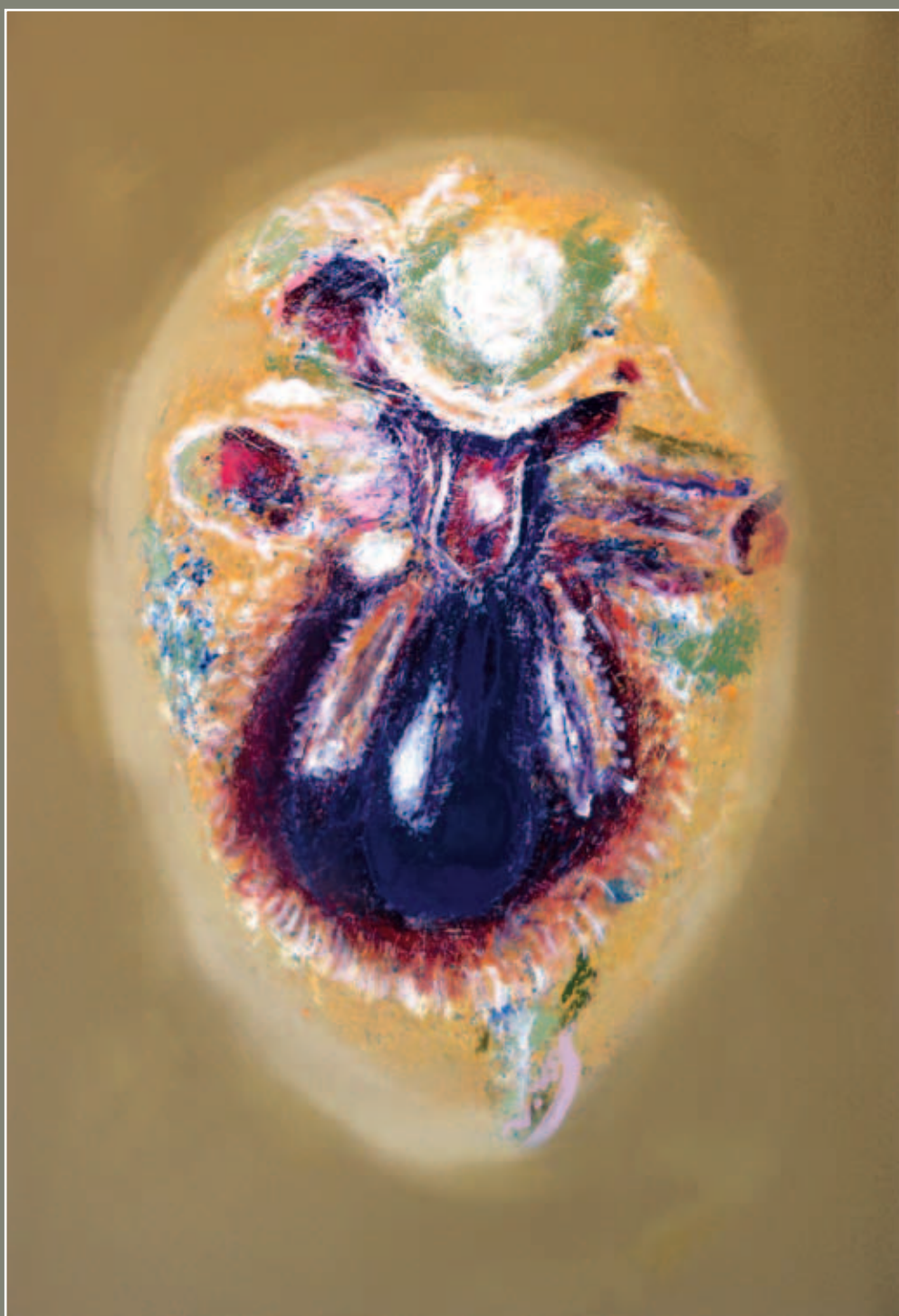
Μελισσούλα 57 X 85 Λάδι σε MTF