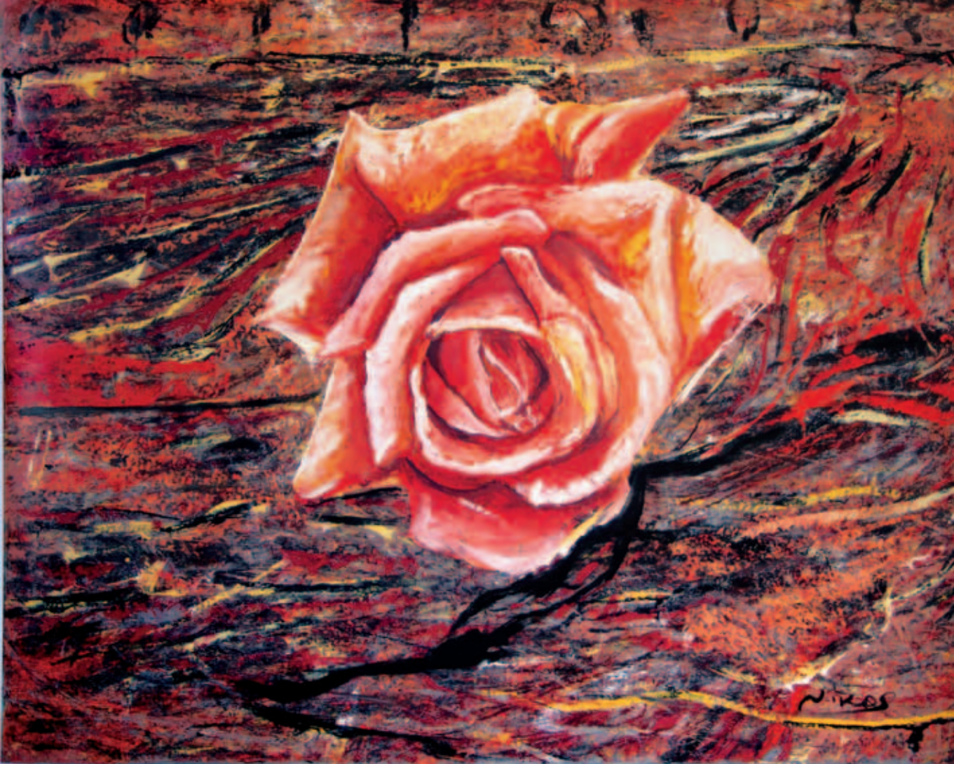
Νεκρή Ζώνη 120 X 100 Λάδι σε Μ.Τ.Φ. 2007